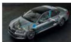
Adaptivní podvozek - volitelné nastavení podvozku ve 3 režimech (Comfort, Normal, Sport)

ŠKODA usnadňuje život svým zákazníkům každý den.