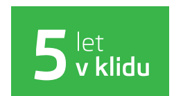
Předplacený servis na 5 let / 100 000 km při financování od ŠKODA Finance