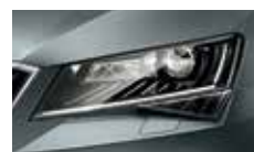
Smart Light Assist - automatické přepínání a clonění dálkových světel