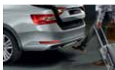
Virtuální pedál - bezdotykové otevírání 5. dveří